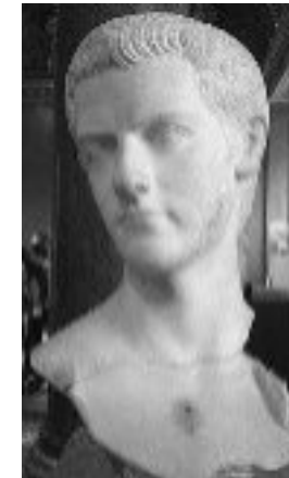
Buste de Caligula exposée au musée du Louvre