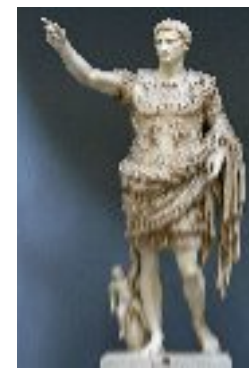
Statue d'Auguste, musée Chiaramonti 1993 Till Niermann

Sum princeps. Diu regnavi Roma. Sum a multis Romanis admiratus. Construi multa templa. Mecum aureum saeculum fuit. Mihi illae res maximae sunt : virtus, iustitia, clementia, pietas et auctoritas. Optimus sum, sed terreo Tiberium. Quis sum ?