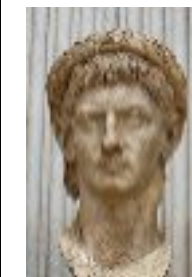
Buste de Claude en Jupiter. Marbre, œuvre romaine, vers 50 ap. J.-C. Provenance : Lanuvium, Italie.

Amo equum meum, puto eum optimum senatorem esse. Populus me timet, quia nescio... Pater praeclarus dux fuit.