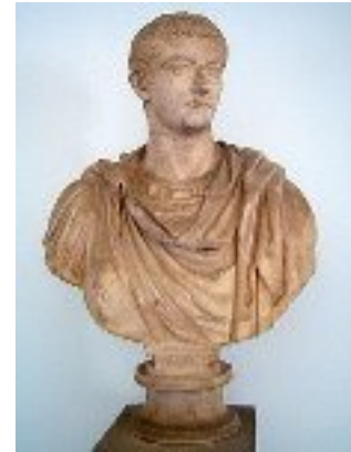
Buste de Tibère, musée archéologique de Palerme.

Tibère Tibère ( Tiberius Claudius Nero ) est né à Rome et est décédé à Misène (ancien port Romain). Il est le deuxième empereur Romain. Son père s'appelait Claudius Nero et sa mère Livia Drusilla. A la mort de son père adoptif, il obtient le nom de Tibérius Julius Caesar Augustus. Durant sa jeunesse, Tibère se distingue par son talent militaire en conduisant avec succès de nombreuses campagnes le long de la frontière septentrionale de l'Empire et en Illyrie, souvent aux côtés de son frère, qui lui est en Germanie. Il a eu deux épouses Vipsania Agrippina et Julia l'aînée. Il s'éloigne de Rome et se retire sur l'île de Capri. Lorsque le préfet essaie de prendre la possession du pouvoir, Tibère le fait destituer et assassiner. L'empereur ne retourne plus dans la capitale où il est haï jusqu'à sa mort. Caligula, fils de Germanicus et d'Agrippine l'aînée lui succède. 14 à 37