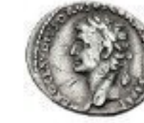
Pièce de monnaie représentant Néron

Néron est né à Antium. Il a été mis au pouvoir en 54 surtout grâce à sa mère. Un jour Néron décide d'assassiner sa mère mais toutes les tentatives pour la tuer se sont vouées à l'échec jusqu'au jour où il ordonna à des soldats d'aller tuer sa mère la nuit dans sa villa. En 66 Néron, maintenant vieux et avec beaucoup d'ennemis, part en Grèce pour un voyage artistique où il joue des pièces de théâtre. A son retour l'empereur se retrouve détesté et apprend qu'on veut lui prendre son pouvoir. Néron mit fin à la dynastie julio-claudien quand il meurt en juin 68 en se suicidant: "qualis artifex pereo" aurait-il dit. 54 à 68